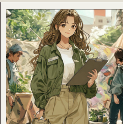
改變世界的理想家