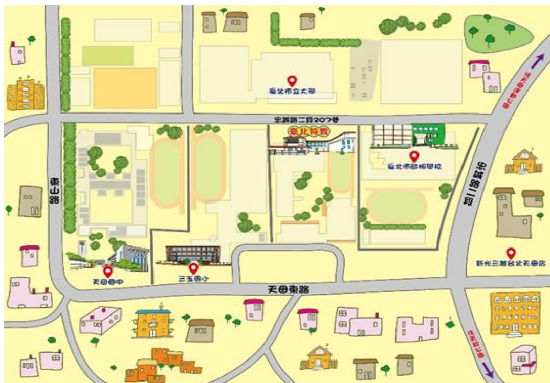
臺北市立臺北特殊教育學校交通路線圖

捷 運：芝山捷運站下車後，步行至忠誠路忠誠公園公車站，搭乘公車 203、279、606、616、685、紅 12、敦化幹線(原 285)至市立臺北特教學校站。