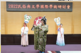
2022民俗與文學國際學術研討會