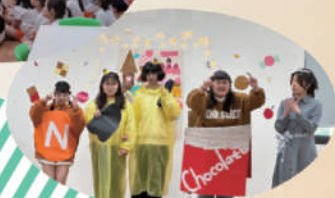
109級幼兒教育學系戲劇公演 【海洋之星Ocean Star】