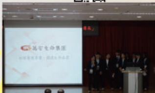
殯葬實習成果發表會